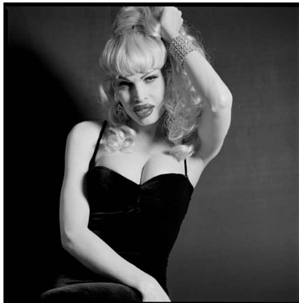
Amanda Lepore, New York, February 7th 1995