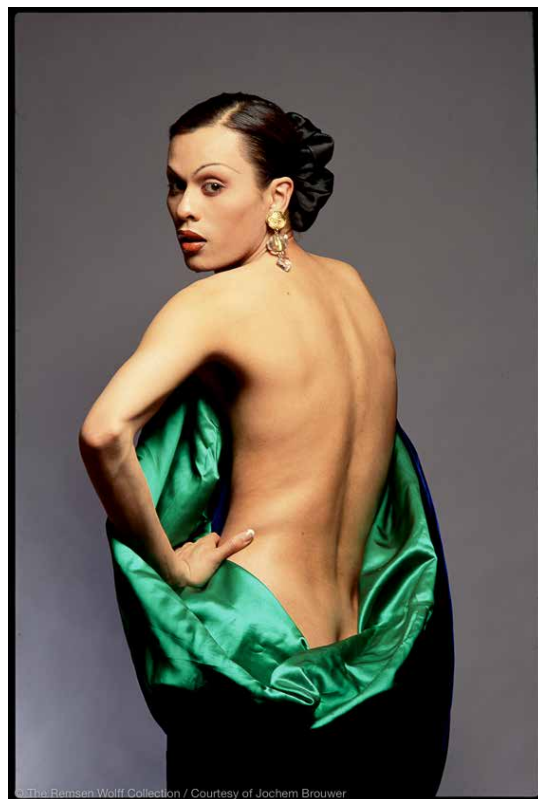
Paris, New York, March 17th 1993